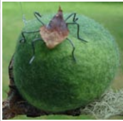
Glimtar från tidigare broderiäventyr